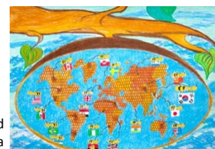
Map, Communicate with the World by Oh Eun Ju (8), South Korea