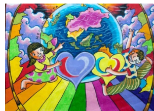
Crafting Our Dreams on the Land of Indonesia by Kenya Kesuma Dewi (5), Indonesia